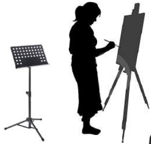
Pantallas opción 2