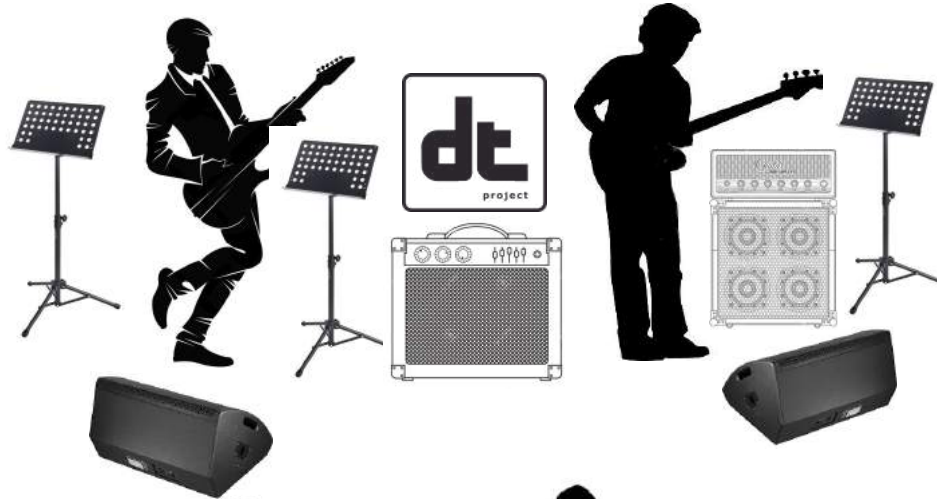
Pantalla opción 1