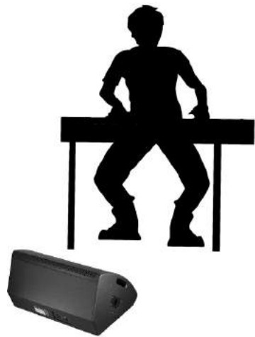
Pantallas opción 2