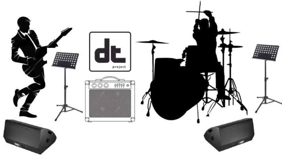
Pantalla opción 1